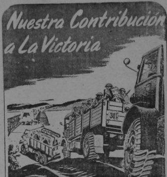
LOS EJERCITOS SOBRE RUEDAS El famoso sello de la Llanta "Trakgrip" (Agarra-Camino) visto en millones de vehículos de Guerra, fue originado por Duloep en 1926 y adoptado por los Servicios para casi todo tipo de Transporte sobre Ruedas.

From further improvement of methods of mining and agriculture will follow a more