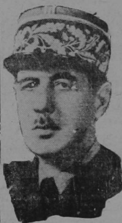
The appearance of the photograph of General Charles de Gaulle. Contd. on Page 8